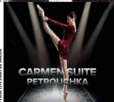
Ballet du Bolchoï