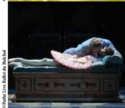
© Pathé Live, Ballet du Bolchoï